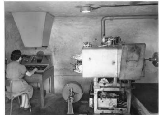
Le prime cartuccere avigliesi sbarcate in Sud Africa